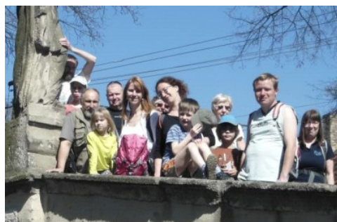
My dnes a naši přátelé