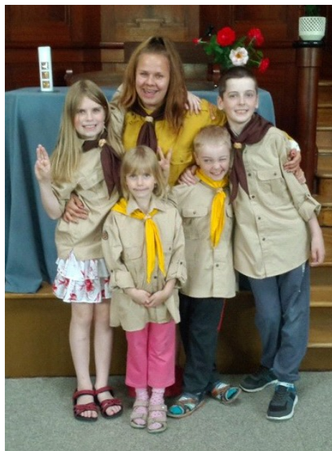
Start 1. 1. 2017

ze skautského odpočinku probuzený vůdce v důchodu