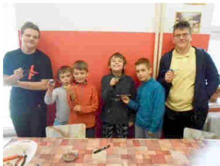
Pár obrazových vzpomínek na prosincové akce